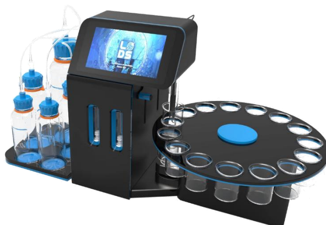
Détermination du PH, de l'acidité totale, de l'acidité volatile après extraction et du SO 2 libre et total

L'appareil permet la détermination du pH, ainsi que le dosage de l'acidité totale en direct et de l'acidité volatile après extraction. Il évite la difficile appréciation du virage coloré en fin de titration, et offre une précision et une reproductibilité optimales des résultats. Fourni avec accessoires de titration et produits nécessaires pour une centaine d'analyses.