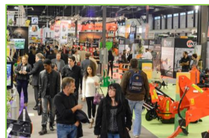
Vinitech-Sifel 2014